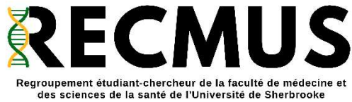
Logo avec nom, couleurs